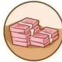
亲友“出事” 急需汇款