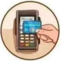
假冒银行提示 刷卡消费