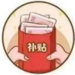
号称机关单位 发放补贴