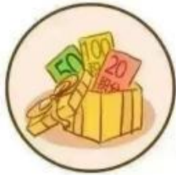
“某公司” 积分兑换礼品