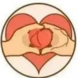
发布虚假爱心 传递诈骗