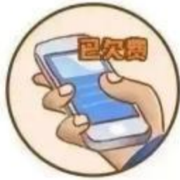
电话/电视 欠费诈骗