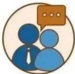
虚构假象 进行诈骗