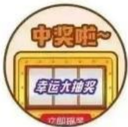
中奖啦! 手机号码被抽中