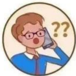
猜猜我是谁? 冒充熟人打电话