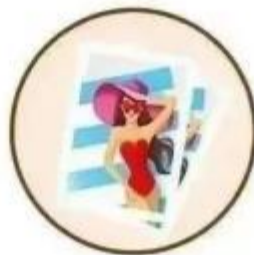
发送“艳照” 进行诈骗